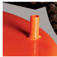
Predisposizione per il collegamento del tubo dell'acqua per la pulizia del piatto