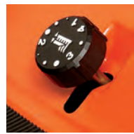
Sollevamento del piatto assistito