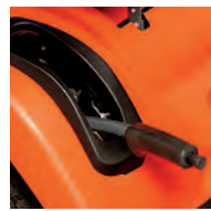
Regolazione dell'altezza di taglio semplificata