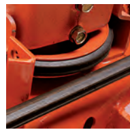
Cinghia esagonale di lunga durata longlife