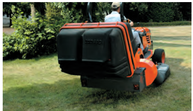
CESTO CON SCARICO BASSO

PNEUMATICI INDUSTRIALI PNEUMATICI GIARDINAGGIO PNEUMATICI AGRICOLI