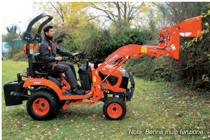
Nota: Benna multi funzione

Il trattorino versatile BX231 è facile da guidare e da manovrare, per dedicarsi in tutta sicurezza anche alle operazioni di taglio più impegnative. Non più lungo di un normale trattore da giardino, il BX231 passa facilmente tra gli alberi e in altri punti stretti del giardino. Inoltre, le sue dimensioni compatte lo rendono delicato sul manto erboso.