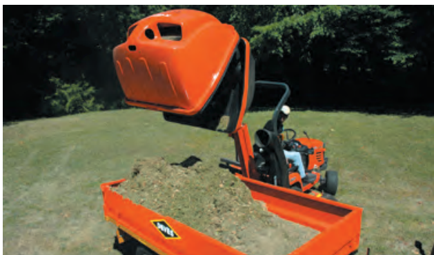
CESTO CON SCARICO ALTO