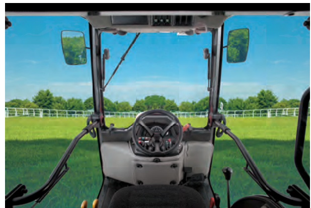
BX231 Optional CAB