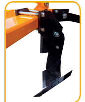
Ancora dissodatore con inserto Tine with tools